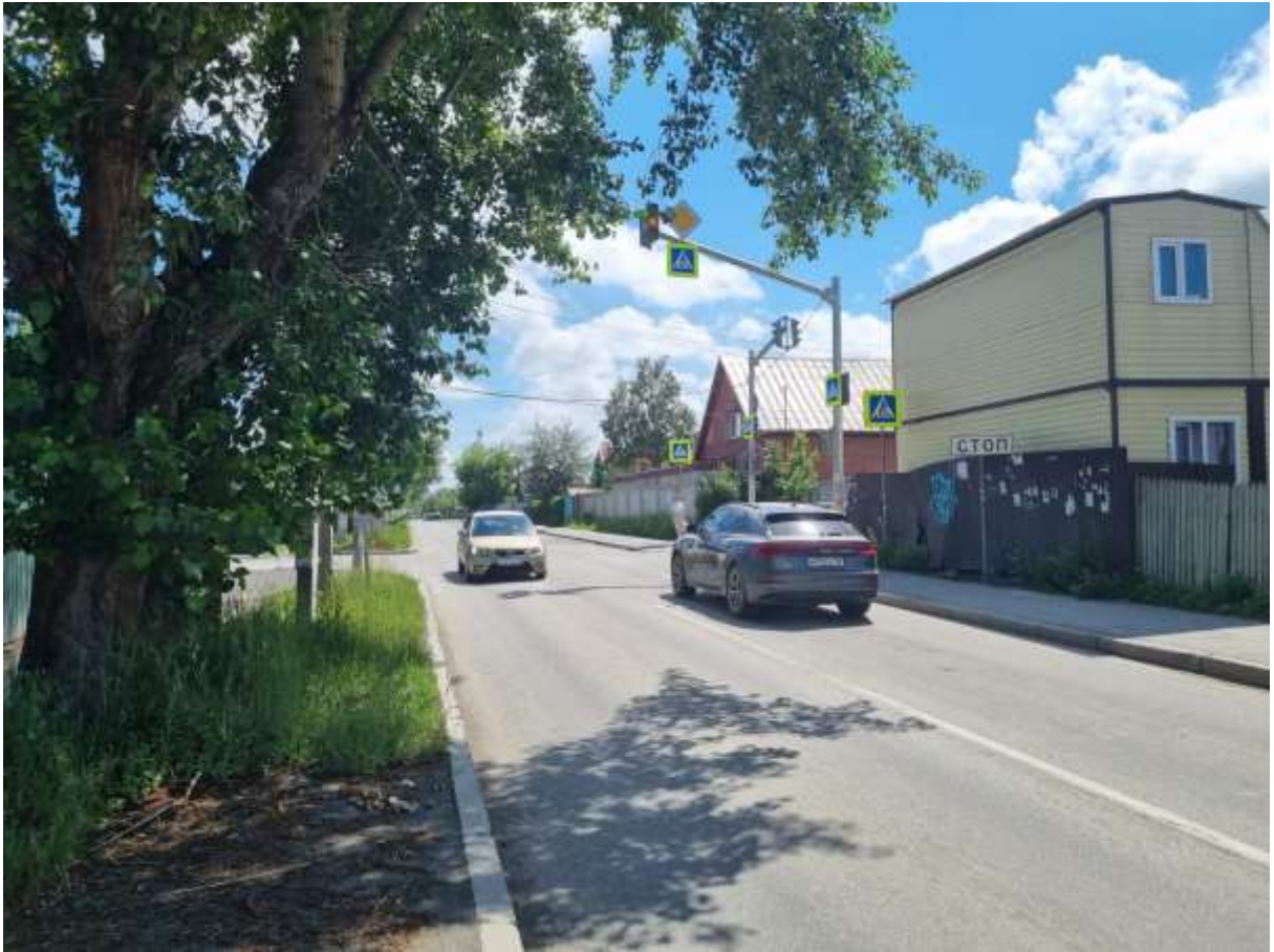
Пересечение улиц Громова-Шаумяна