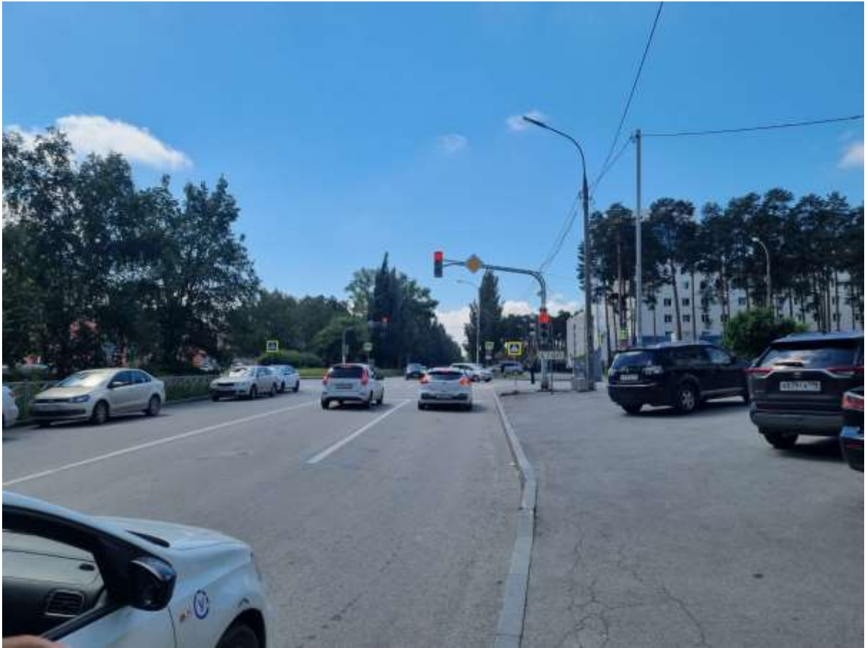
Пересечение улиц Волгоградская- Громова