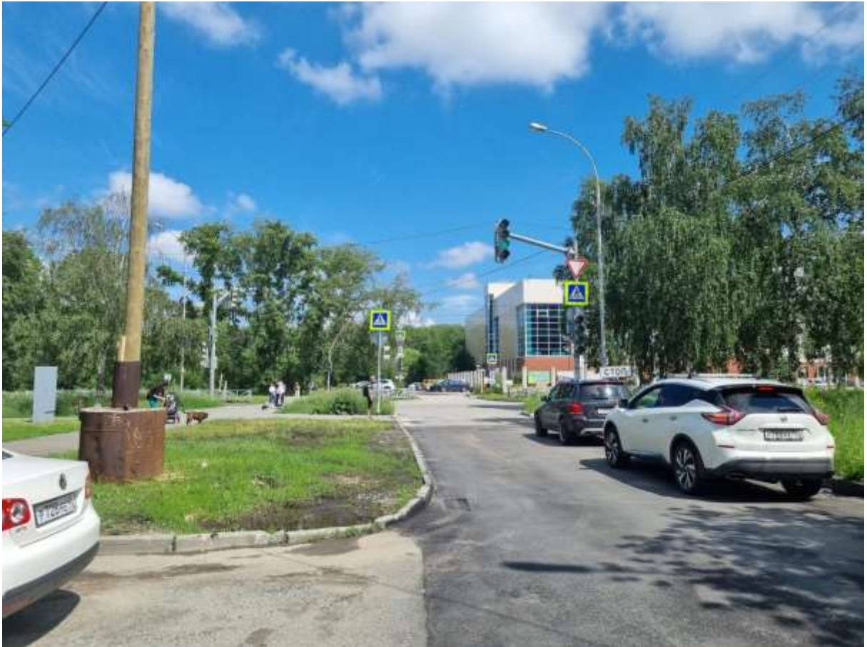
Улица Ясная на участке между Шаумяна и Волгоградская